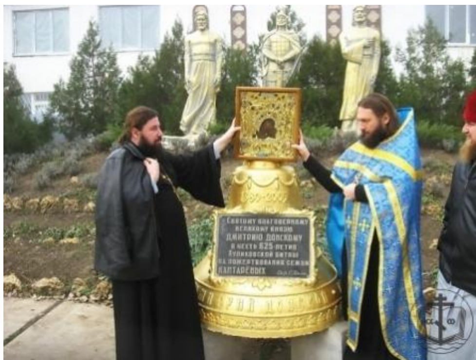
Пам'ятний комплекс в м.Арциз на честь 625-річчя Куликовської битви м.Арциз