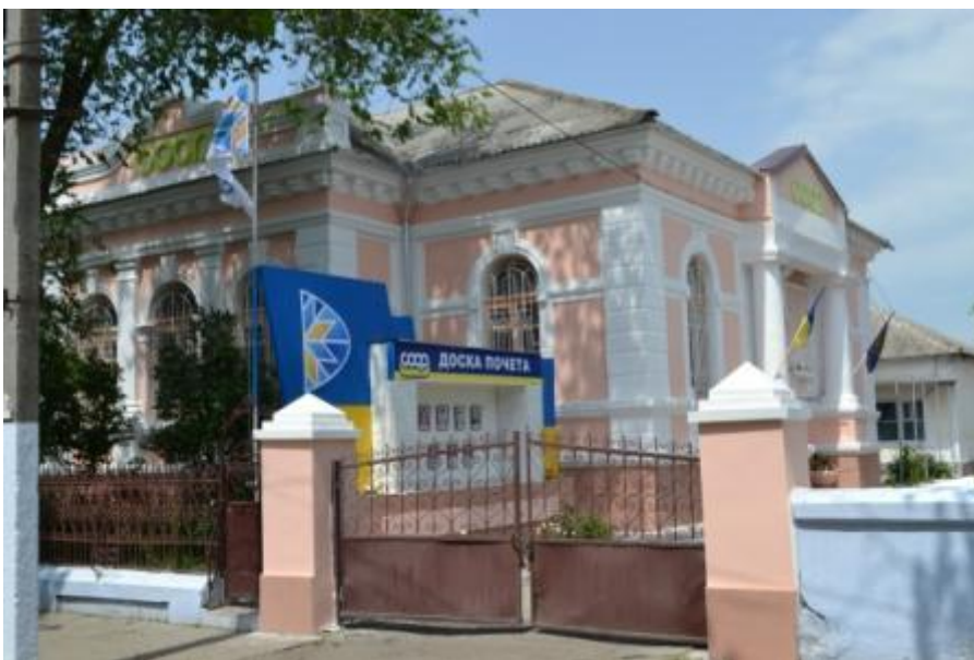
Будівля Арцизької РПС

- пам'ятник архітектури – колишній особняк німецьких колоністів, м.Арциз