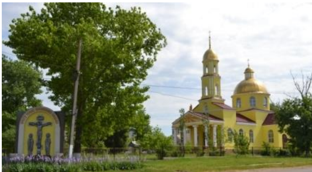
Храм Апостола Іоана Богослова

Пам'ятник в с.Нова Іванівка Інзову І.М. – генералу – лейтенанту, наміснику Бессарабії, головному опікуну іноземних поселенців Південного краю (1768 – 1845),