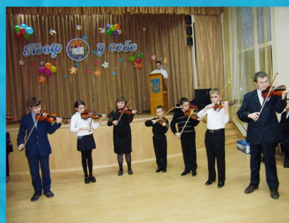
"Нас окрилює музика" - ансамбль скрипалів