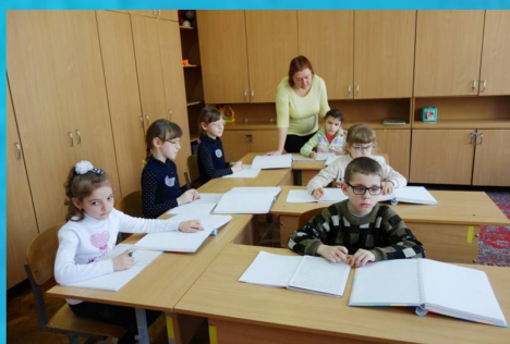
"Взявши зошити й книжки, ми вчимося залюбки" - урок учнів у першому класі

"Забезпечення права громадян на здобуття дошкільної та загальної середньої освіти, зміцнення здоров'я, розвиток і формування особистості, забезпечення соціально-психологічної реабілітації та адаптації дитини шляхом спеціально організованого навчально-виховного процесу у комплексі з корекційно-розвивальною та лікувально-оздоровчою роботою".