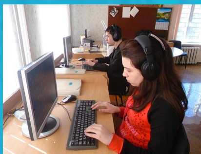
"Подорож безмежними просторами інтернету" - Факультативне заняття в комп'ютерному класі