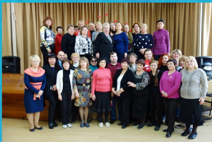
Педагогічний колектив школи

65078, м. Одеса. вул. В. Терешкової, 25-а, тел.: 765-22-55, 765-39-60, факс: 765-42-17 E-mail: interschool93@gmail.com сайт: www.school93.od.ua