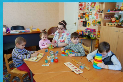
"Хочемо все вміти, хочемо все знати" - корекційне заняття вихованців дошкільної групи