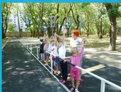
"Вчимося пізнавати навколишній світ" - корекційне заняття учнів першого класу