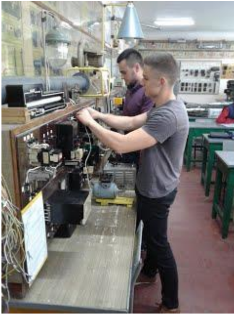
Фото навчального закладу